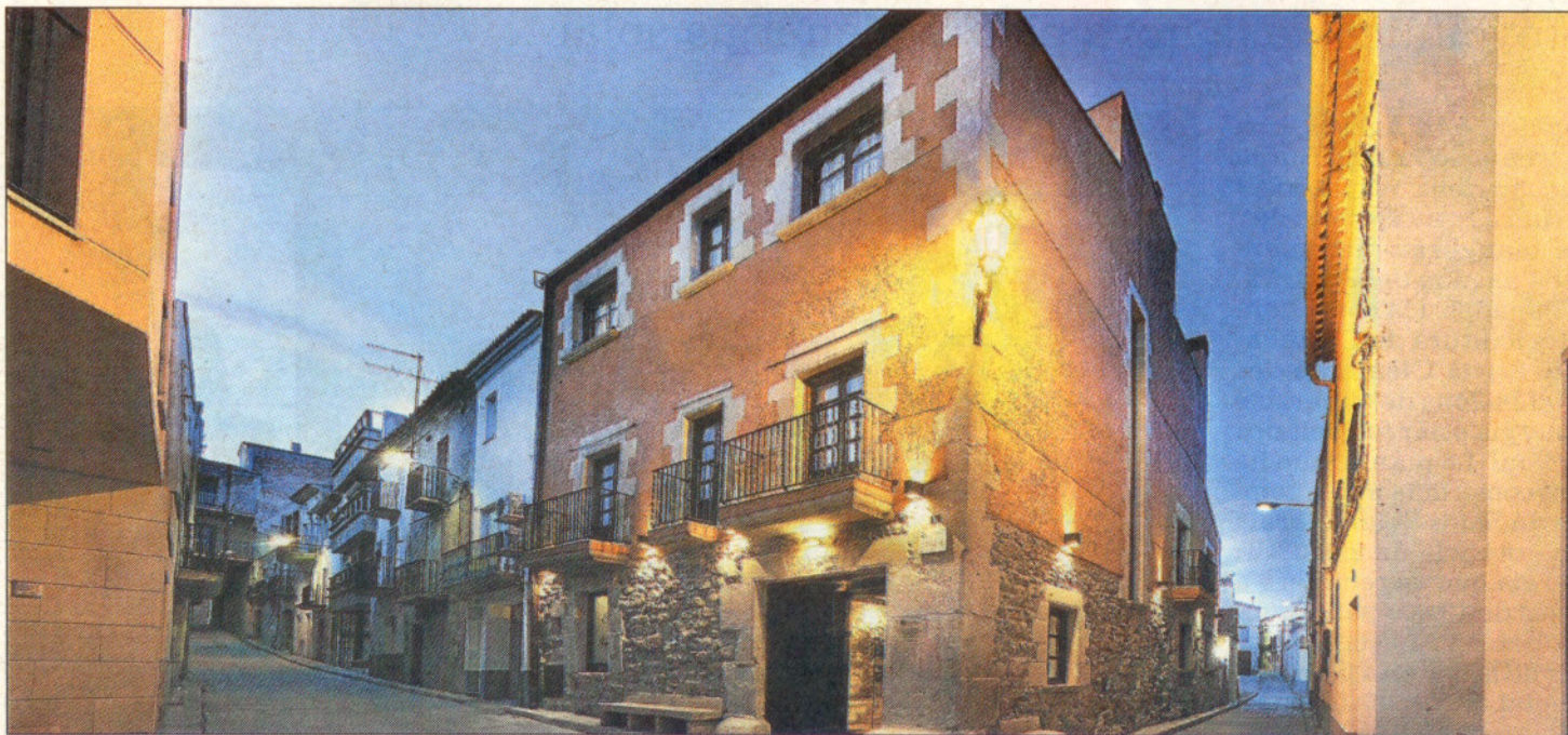
L'Hotel Cal Rotés és una casa pairal del segle XVIII totalment restaurada amb els materials originals.

L'Hotel Cal Rotés és el resultat de la rehabilitació d'una antiga casa pairal que ofereix un ambient relaxat i tranquil, que conjuga les parets de pedra antiga amb el wi-fi; un gran celler amb piscina interior i l'encant de la tradició amb la vida pausada de poble.